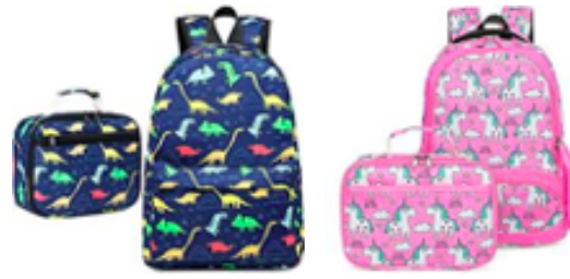
mocila y lonchera (opcional)