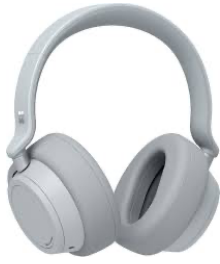
1 par de audífonos