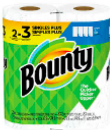
Toalla de papel