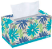
2 cajas de pañuelos