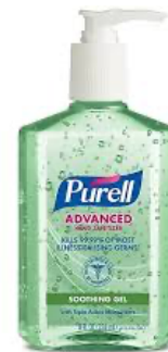
botellas de desinfectante de manos